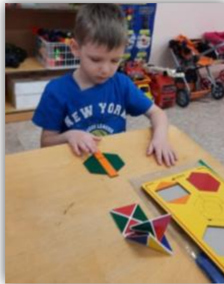
Рис. 4 «Яблонька»

На пути героев встречается печь. Игра «Чудо-крестики». Детали выкладываются по контуру. Сначала мы с детьми проговариваем какие детали надо использовать, и затем ребята приступают к работе. Здесь формируется умение ориентироваться на бумаге.