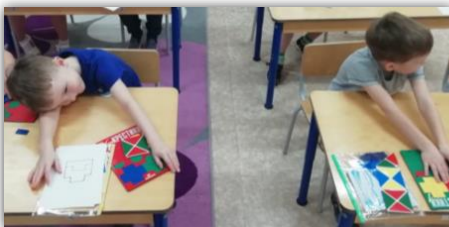
Рис.7 Ритуал «Обнимашки»

(слайд 14) В конце занятия под песню «Будьте здоровы, живите богато» мы подвели итог, обсудили чему нас научила сказка и дети ответили на вопрос «Какая из игр сегодня помогла больше всех?» и звучит всегда один ответ «ВСЕ!» Дети, показывая, что им нравятся все игры, изображают «обнимашки» на столе. Этот прием часто использую в своей работе (рис. 7)